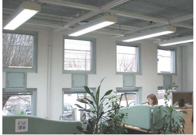
Reed Business Oy, Espoo

Publico on lehtitalo, jossa päivänvalovalaisuksesta on erityistä hyötyä. Valaistus on tyypiltään suoraa. Se sopii hyvin molempiin yllämainittuihin toimistoihin, valoa on riittävästi eikä valo heijastu näyttöpöätteistä häiritsevästi.