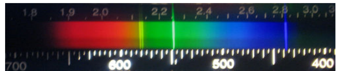
Viva-Liten spektri on jatkuva, kaikki värit (aallonpituudet) näkyvät.