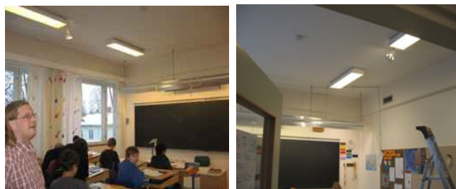
Samppalinnan koulu, Turku

Luokassa oli alussa lämminsävyiset, väsyttävää valoa antavat, ei-jatkuvaspektriset, tavalliset loistelamput, värisävy 830. Huoneen seinät ja katto värjäytyvät kellertäviksi, epänormaalin värisiksi. Valaisimiin vaihdettiin täyden spektrin Viva-Lite-päivänvalolamput. Luokassa oleva valo on nyt hyvin samankaltaista kuin ikkunoista tuleva valo. Valo on valkoista, piristävää. Ikkunaverhot ovat nyt kauniin ja kirkkaan värisiä. Värit taulun oikealla puolella ovat nyt aitoja kuten ulkovalossa. Huoneessa nähdään hyvin. Se johtuu siitä, että valossa on kaikki päivänvalon aallonpituudet (värit). Niitä kaikkia tarvitaan näkösuorituksen muodostamiseen ja parhaan mahdollisen oppisuorituksen saavuttamiseen.