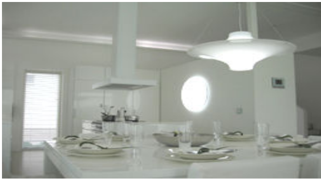
Jämerä-Kivitalo, Vaasan asuntomessut

Eikä tässä vielä kaikki. Kun valaiset työpaikkasi täyden spektrin päivänvalolla, saat siitä "pehmeän laskeutumisen" myös kotisi valaistukseen. Monet valaisevat koko kotinsa päivänvalon kaltaisella valolla havaittuaan sen edut. Kuvassa oleva Lokki-valaisin on päivänvalolla valaistuna puhtaan valkoinen eikä keltainen, kuten yleensä Suomen kodeissa. AD-Lux on Suomen suurin kotien valaisija päivänvalon kaltaisella valolla.