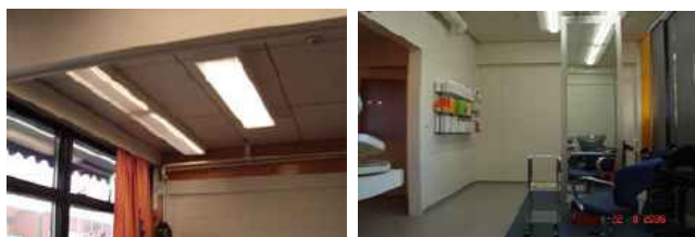
Parturi-kampaamo Hiusmeri, Raah

Kuva vasemmalla ennen valaistusremonttia. Myös kalusteiden värit vääristyivät. Työntekijöillä oli päänsärkyä. Kuva oikealla valaistusremontin jälkeen. Kattoon asennettiin 10 kpl 2-lamppuista 2x58 W:n päivänvalovalaisinta. Kalusteiden värit ovat nyt aitoja. Tässä on omistajan kommentteja: