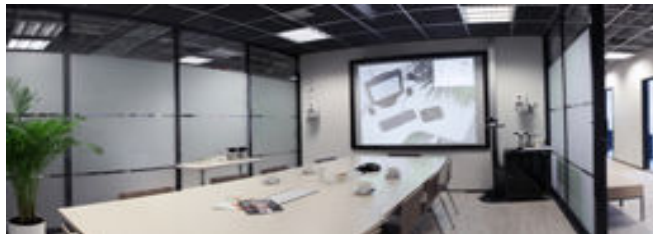
Adage Oy, Helsinki

Neuvotteluhuone raikkaassa päivänvalovalaisuudessa. Katon rajassa on epäsuora valaistus WT-4-sisustuslistan päällä ja kattovalaisimissa Viva-Lite-loistelamput.