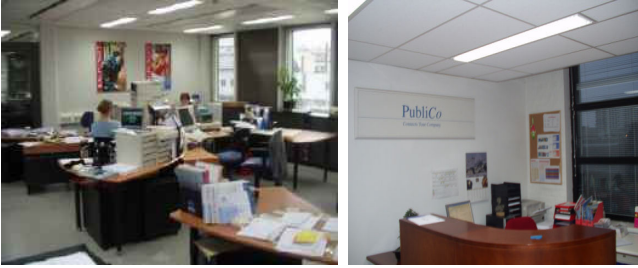
Vasemmalla Suomen Matkatoimisto, WTC, Turku Oikealla Publico Oy, Helsinki

Suuren matkatoimiston liikematkojen osasto valaistiin ensi kerran vuonna 1997 täyden spektrin päivänvalolla. Lamput vaihdettiin ryhmävaihtona ensi kerran v. 2002. Henkilökunta halusi samaa valoa kuin aikaisemminkin.