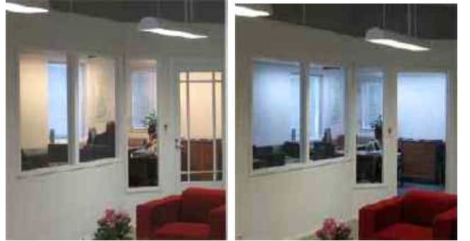
Stera Technologies, Kaarina.

Reed Business -lehtitalon henkilökunta on ihastunut päivänvalon kaltaiseen valoon siinä määrin, että useilla sen työntekijöillä on samaa valoa myös kotonaan.