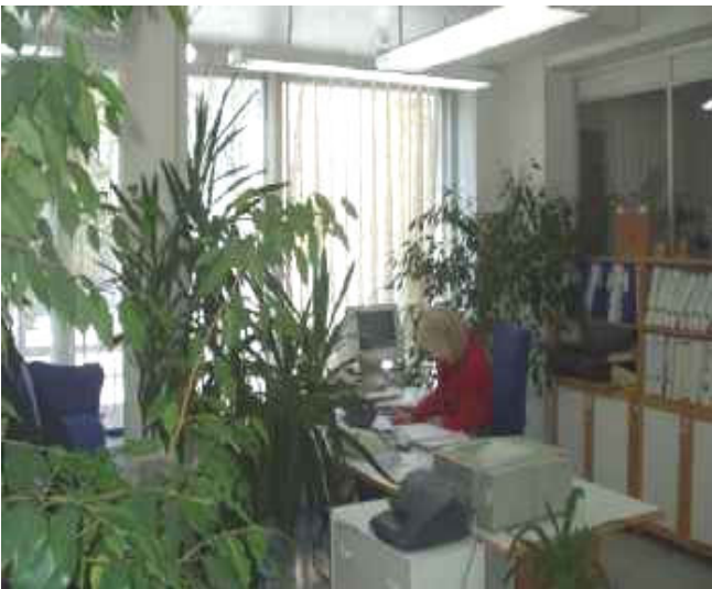
Ilmalinja Oy, Helsinki

Päivänvalovalaisuksen hinta tässä huoneessa on n. neljä senttiä vuorokaudelta (myös lomat ja viikonloput mukaan laskien), jos lamput vaihdetaan 5 vuoden välein. Vertaa sitä vaikkapa kahvikupillisen hintaan.