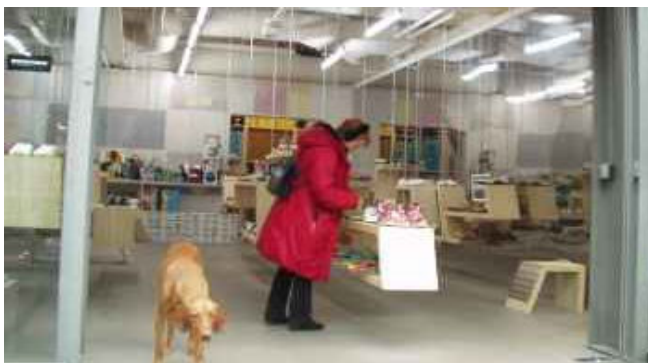
Jalkinemyymälä Skuutio, Helsinki

Yhtään häikäisevää spottivaloa ei ole. Tuotteet valaistetaan täysspektrisellä valolla, joka näyttää värit mahdollisimman hyvin. Kun valaisimet on varustettu laadukkaasti valon lisäksi värinän poistavalla elektroniikalla, saadaan aikaan erinomainen, häikäisemätön myymälävalaistus.