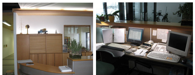
Finepress Oy, Turku

Saalinki-valaisimet kaapiston päällä antavat kauniin vaikutelman. Valoa leviää huoneeseen seinän ja katon kautta.