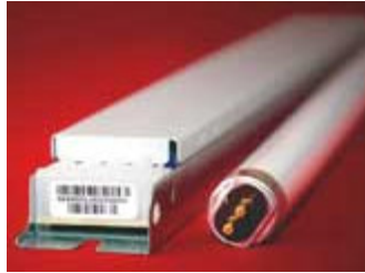
Valaisinelektronikka ja lamppu